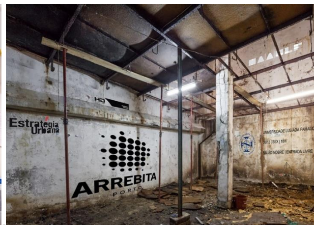
Pedro Saraiva - IAGUS - Ribatejo interior