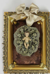
Relicários Oficina das Hortas